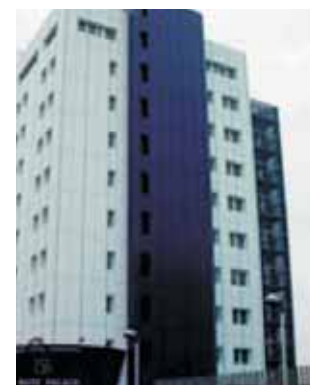
Sistemi GHP AISIN: impatto esteriore inesistente

Traditional systems: downgrading exterior impact