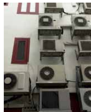
Sistemi tradizionali: impatto esteriore dequalificante

Air-conditioning a building means decreasing its aesthetic value. Our heat pumps, on the other hand, allow for the air-conditioning operative centre to be located at a single point outside the structure, helping communicate your choice for environmental sustainability also through the preservation of the building's look. Installation is designed and adapted to your structure's requirements to allow even the internal environments to respect their various 'characters'.