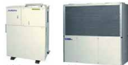
MCHP microgeneratore a gas

Tecnocasa Climatizzazione has been working in the field of energy saving since 1978. Thanks to our willingness to look to innovation, in 2000 we earned the trust of Aisin, the second most important company of the TOYOTA group. Today, we are the sole European distributors of gas heat pumps and gas micro-cogeneration systems produced by Aisin, and work through a capillary network of agents, dealers and technical assistance centres all over Europe.